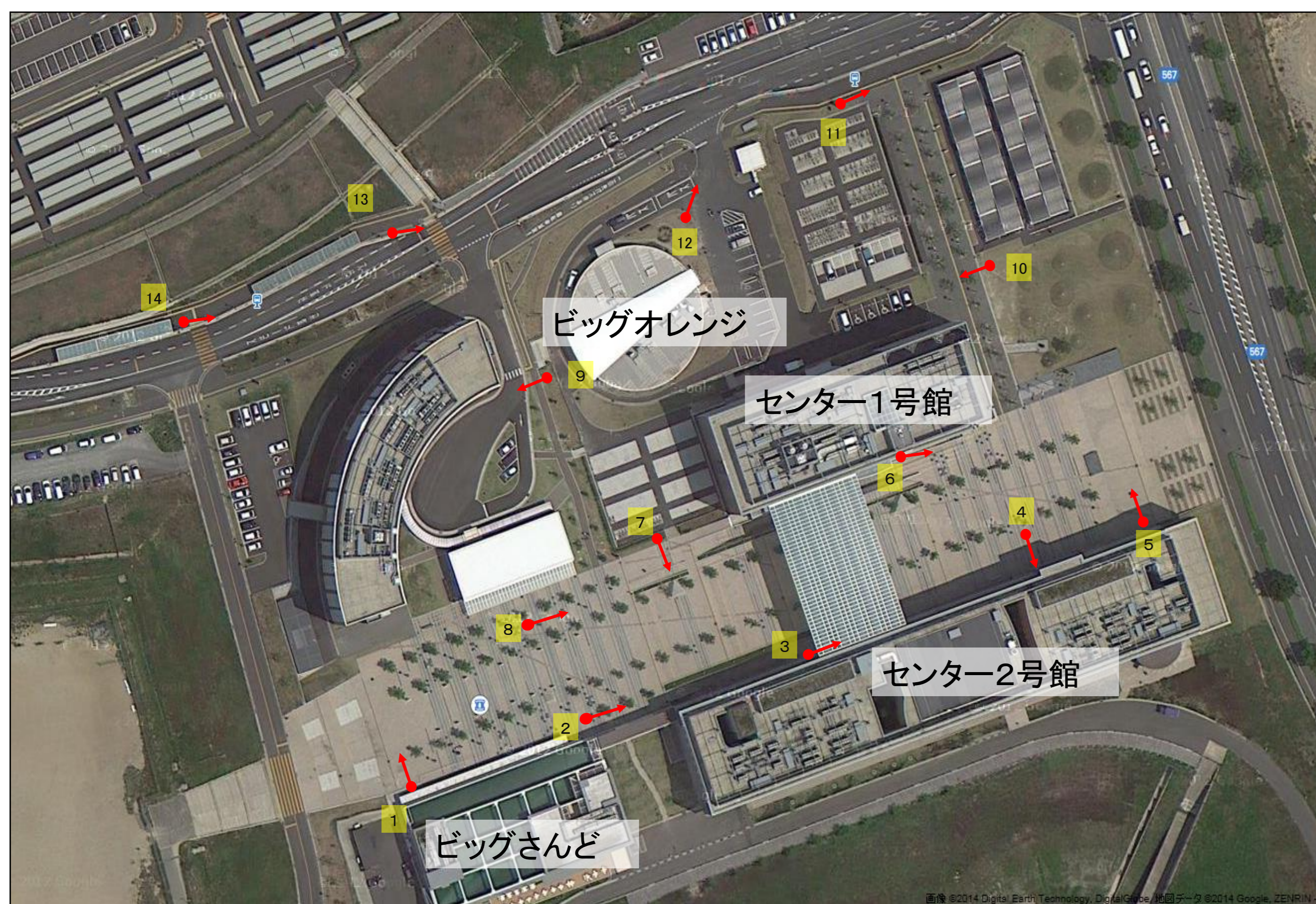
九州大学伊都キャンパスセンターゾーン地区

九州大学伊都キャンパスのセンターゾーン地区に、ポール型センサーノード Petit Sensor Box 14基を設置し、人流解析を実施する。このエリアは、日中人口が 5000 人を超えており、人流が集中するとかなりの混雑が発生する。本実証実験により、キャンパス内の人流を解析することで、講義室や食堂の混雑度などの予測など、さまざまなアプリケーションの創出が可能となる。